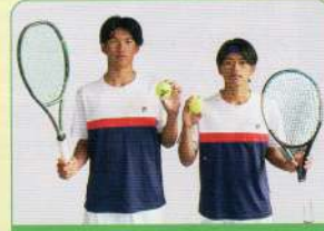
男子硬式テニス部