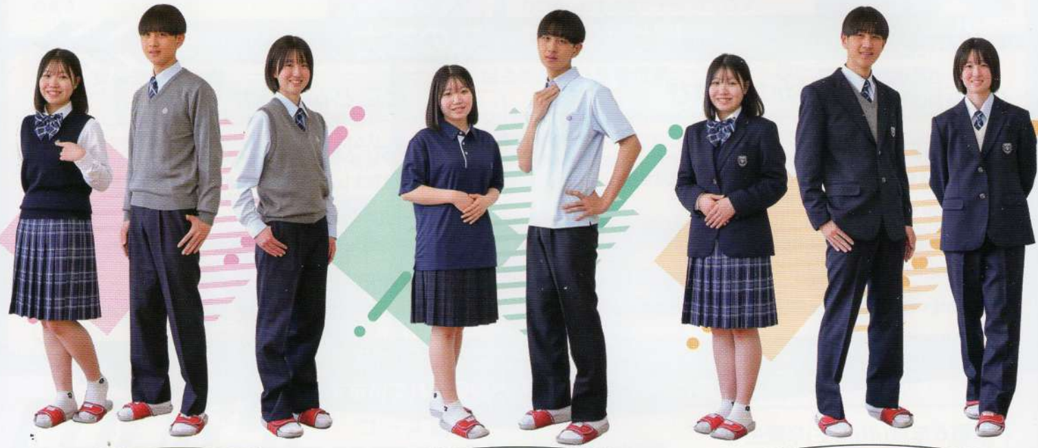
SPRING & AUTUMN