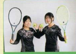
女子硬式テニス部