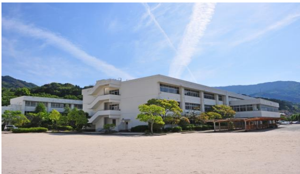
柏陵高等学校 校舎

昭和58年に創立され、「進取・創造・敬愛」という校訓のもと、心豊かで、志をもって逞しい生き方のできる人間の育成をめざしています。