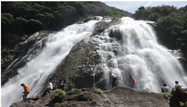
普通科・環境科学コースの「屋久島研修」

昭和58年に創立され、「進取・創造・敬愛」という校訓のもと、心豊かで、志をもって逞しい生き方のできる人間の育成をめざしています。